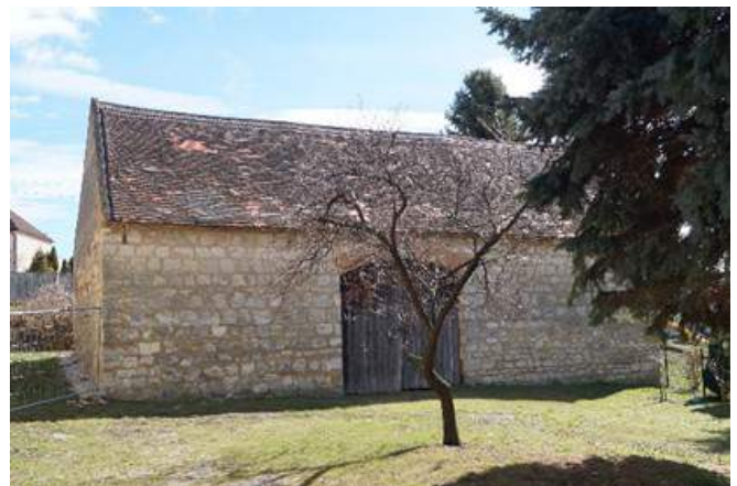
Stadl nach Renovierung