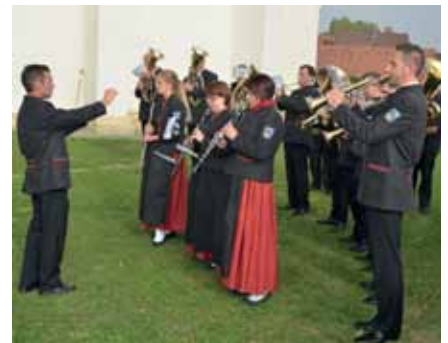
Der Musikverein „Frohsinn“ Marz begleitete die Erntedankprozession und gestaltete die Messe mit

Bei der Gestaltung der Messe wirkten die Kindergartenkinder und Volksschulkinder in bewährtem Stil mit. DANKE. Wie jedes Jahr umrahmten der Kirchenchor, der Gesangsverein „Liedertafel“ Marz und der Musikverein „Frohsinn“ Marz das Fest. DANKE.