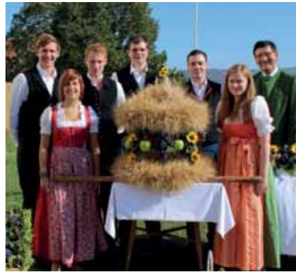
Die Erntekrone wurde von den Robischburschen und -mädchen zur Kirche getragen