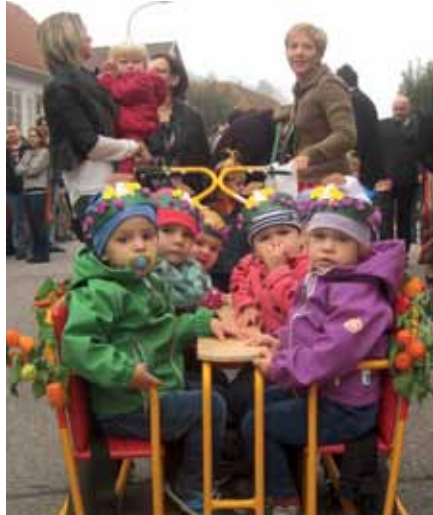
Auch die Krippenkinder waren beim Erntedankfest dabei