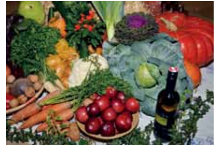
Auch die Kirche erstrahlte dank kreativer Damen im „Erntedank-Glanz“

es sich zu danken lohnt. Dass wir jederzeit zu essen haben, oder dass wir in einem sicheren Umfeld leben, was den Flüchtlingen in ihrer Heimat nicht gegönnt ist.