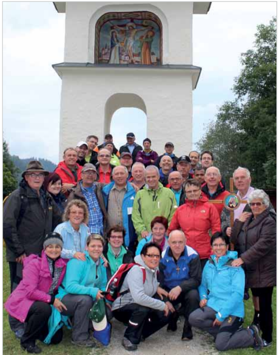
Glücklich am Ziel angelangt Nach drei Tagen gelebter Gemeinschaft sind alle Wallfahrer beim „Luckerten Kreuz“ angekommen

Ich habe einmal einen Spruch gehört oder gelesen: „Pilgern ist beten mit den Füßen“. Ich bin allerdings auch der Meinung, die