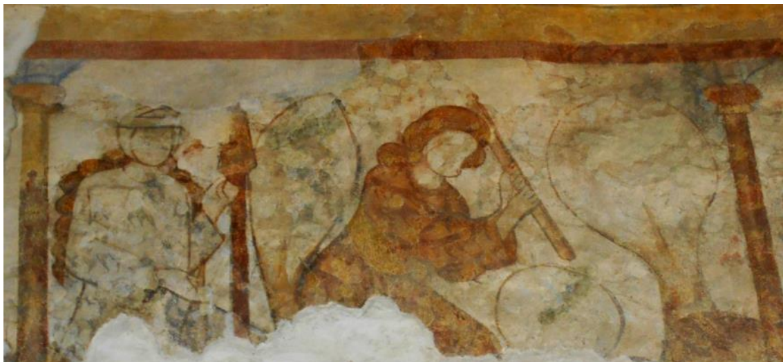
Wandmalerei an der Nordwand des Langhauses (um 1280/90): Die Stammeltern nach der Vertreibung aus dem Paradies. Eva (links) am Spinnrocken und Adam mit Dreschflegel.