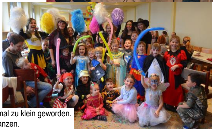
Beim Kindermaskenball am 5.2. ist der Pfarrsaal wieder einmal zu klein geworden. Die Kinder hatten viel Spaß beim Verkleiden, Bemalen und Tanzen.