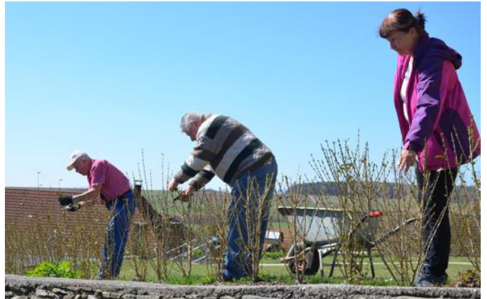
Die im Vorjahr neu angepflanzte Hecke auf dem Kirchenplatz wurde zum Frühjahrsbeginn geschnitten, damit sie sich besser in die Breite entfalten kann.