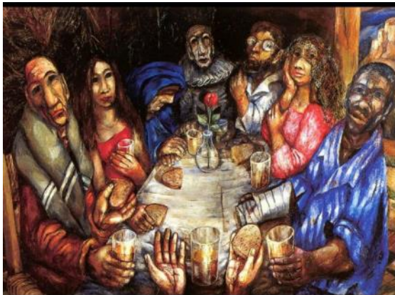
Jesu Mahl mit den Sündern

Der Kreuzestod ist somit die logische Konsequenz des Lebens Jesu. Sein Leben verstand er zu jedem Zeitpunkt als absolute Liebe zu den „verlorenen“ Menschen. Sein Tod ist daher keine Sühne für unsere Sünden, sondern radikale