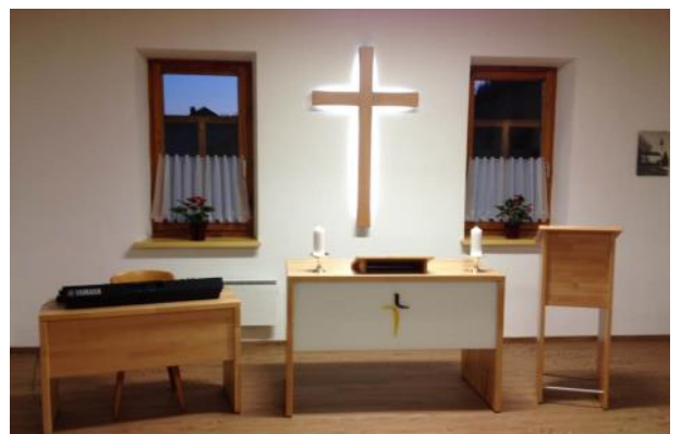
Der neue Betsaal in Grodnu