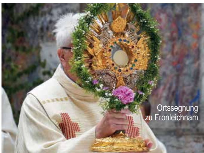
Ortssegnung zu Fronleichnam