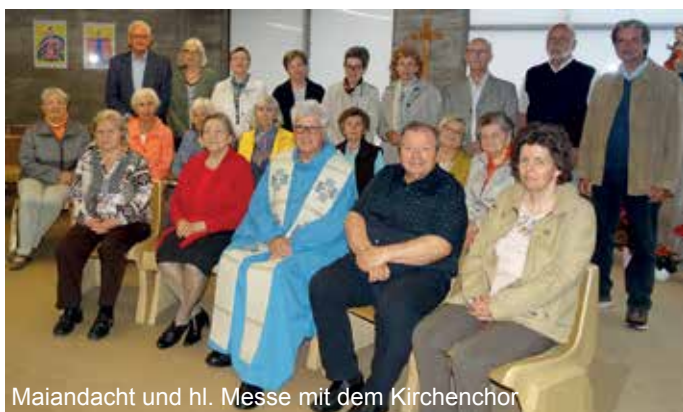
Maiandacht und hl. Messe mit dem Kirchenchor