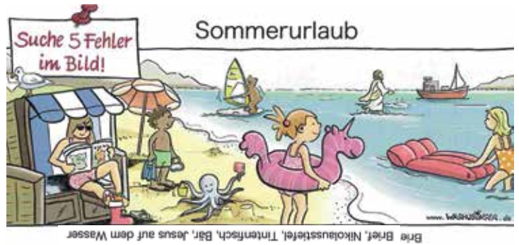
Breie Brief, Nikolausstiefel, Tintenfisch, Bar, Jesus auf dem Wasser