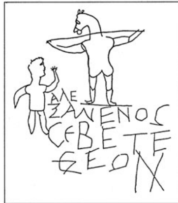
Bild aus Römerzeit