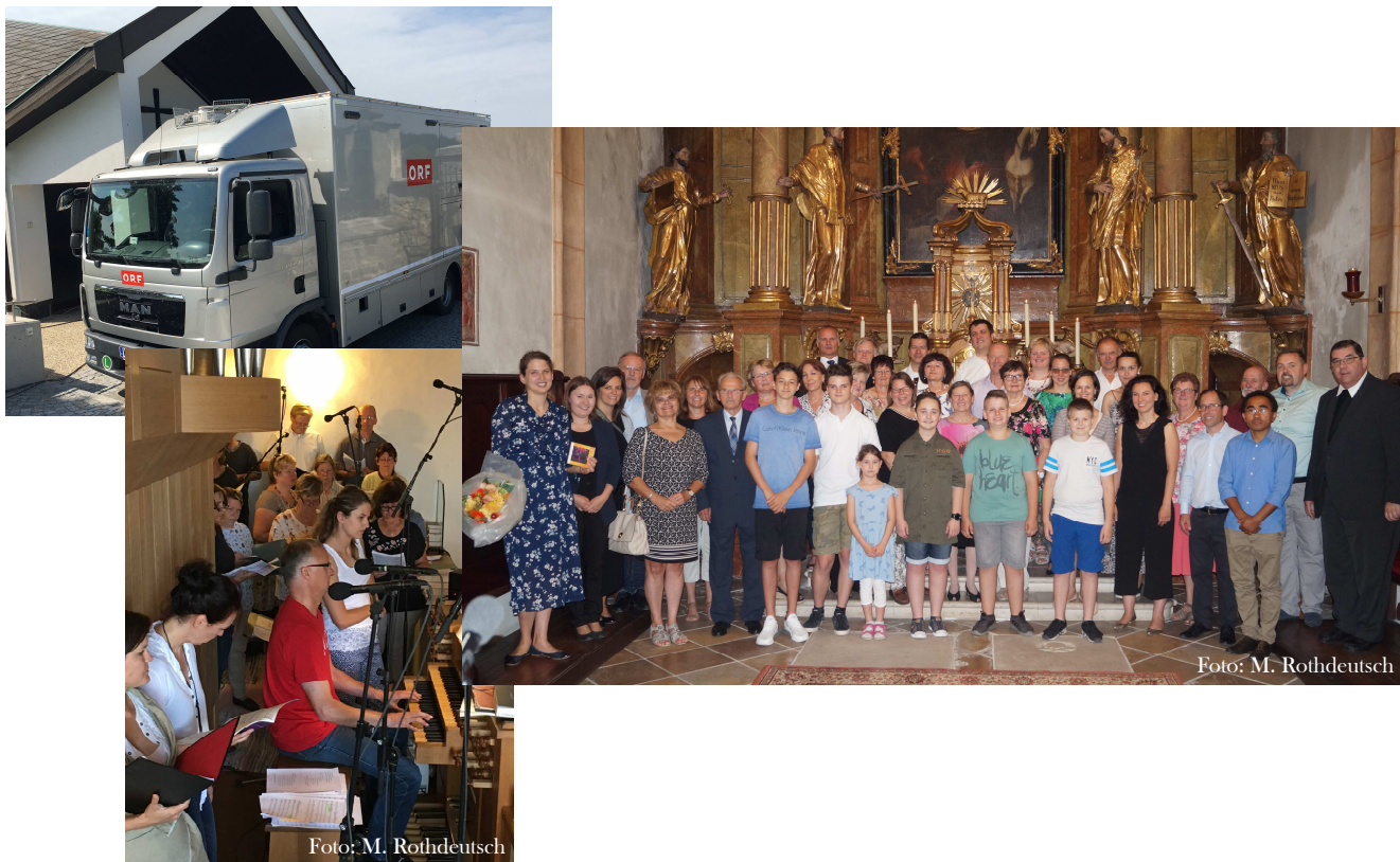
ORF –Katholischer Radiogottesdienst: Die Messe am 11. Sonntag im Jahreskreis wurde aus der Pfarre Kleinhöflein - Stadtpfarrkirche zum hl. Vitus - übertragen. Vielen Dank an alle Mitwirkenden!