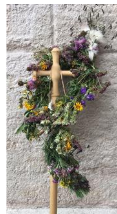
Dieses Mal marschierten die Fußwallfahrer mit einem Pilgerkreuz, das immer wieder mit frischen Blumen vom Wegesrand geschmückt wurde.