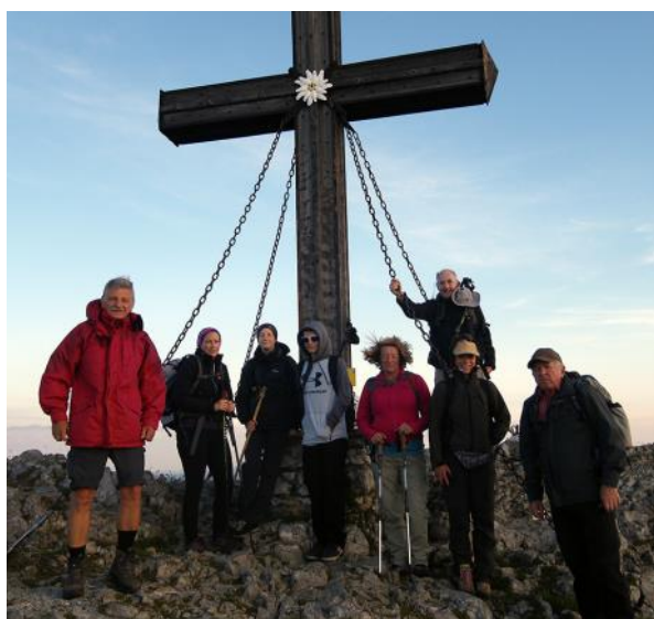
Die Hohe Veitsch ist erreicht - ein Glücksgefühl!