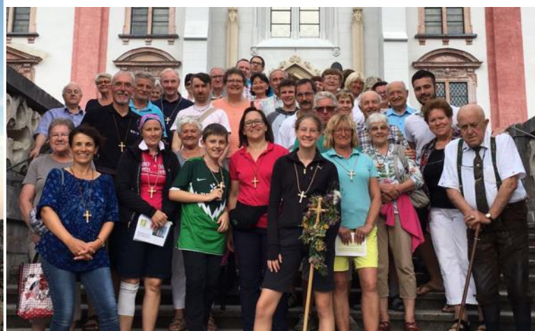
Vor der Basilika in Mariazell mit den „Buswallfahrern“ der Pfarre