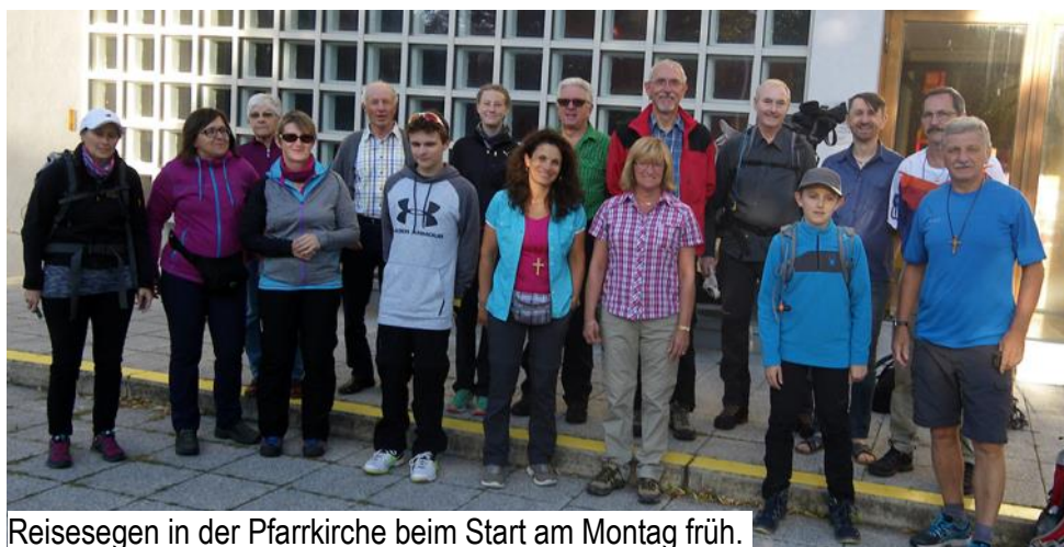
Reisesegen in der Pfarrkirche beim Start am Montag früh.