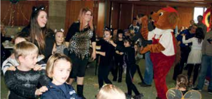
Kinder- masken ball