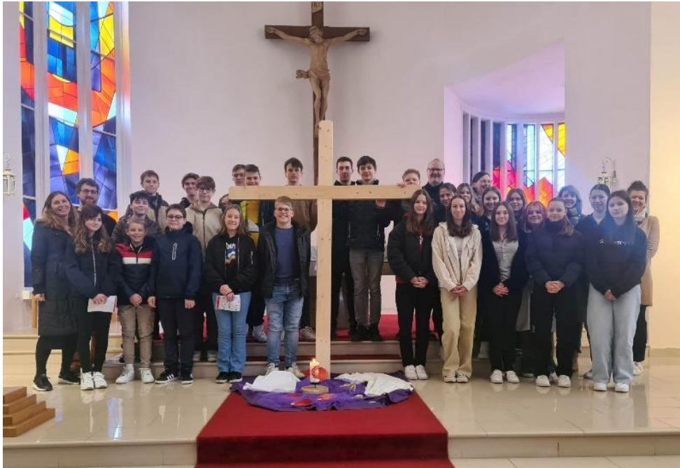
12.März unsere Firmlinge gestalten den Kreuzweg