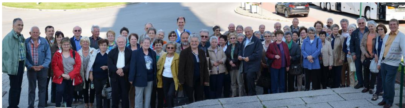
Die Teilnehmer des Ausflugs vor der Kirche in St. Andrä.