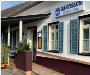
Gasthaus Pilz Hauptstraße 10 8383 St. Martin/R.

Herzlichen Dank und gutes Gelingen beim Ausprobieren!