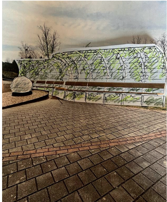
Skizze und Foto: DI Ernst Halb

Wenn Sie die Pfarre St. Martin/Raab für weitere Investitionen am Kirchplatz mit einer Spende unterstützen möchten, dann bitten wir Sie diese auf das Konto – IBAN: AT76 3302 7000 0261 6654 bei der Raiffeisenbank - Verwendungszweck: Spende Kirchenvorplatz – zu überweisen oder Sie verwenden den beiliegenden Zahlschein.