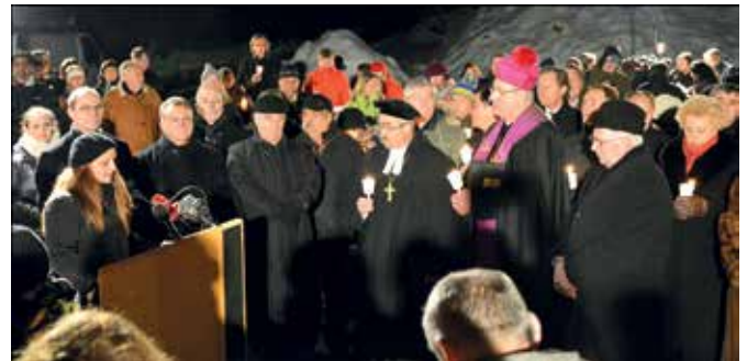
Gedenkfeier: 20 Jahre „Roma-Attentat“

21. März ref. Pfarrgemeinde, Altes Pfarrhaus 18. April ev. Pfarrgemeinde AB, Festsaal 30. Mai r.kath. Organisation, Abschlussfest am Stieberteich mit Grillen