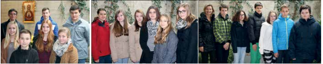
Unsere Firmkandidatinnen und Firmkandidaten