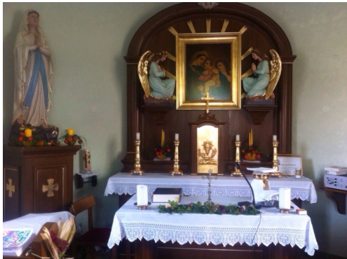
1. Reihe: Erntedankfest in Neustift/Lafnitz