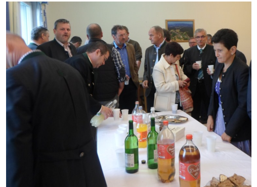
Linke und rechte Seite: Erntedankfest in Kroisegg