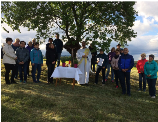
Maiandacht in Kroisegg beim Kernbauer-Kreuz

Das heurige Jahr war geprägt durch die Unsicherheit der Ansteckungsgefahr mit Covid-19. Trotz der damit verbundenen Einschränkungen konnten 3 der 4 geplanten Marienandachten gehalten werden. Für viele der Teilnehmerinnen und Teilnehmer war es nach der strengen Zeit der Quarantäne die erste Möglichkeit Freunde wiederzusehen. Den Reigen eröffnete Unterwaldbauern beim Kreuz der Familie Losert. An diesem Nachmittag durften wir "Maria als Schwester im Glauben" kennen lernen.