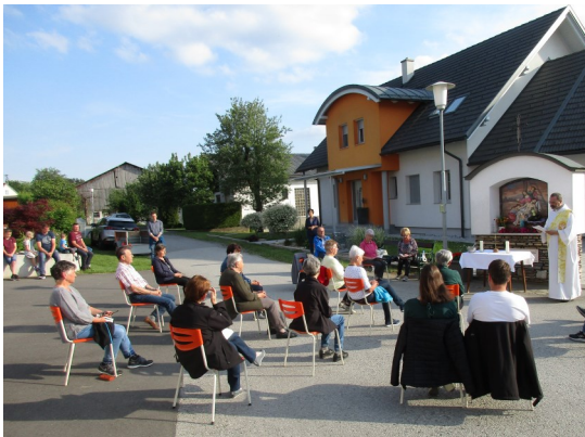
Maiandacht in Neustift-Schwaben