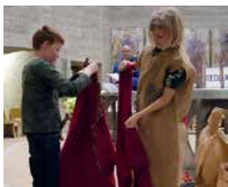
Bei der Martinsfeier ging es ums Teilen