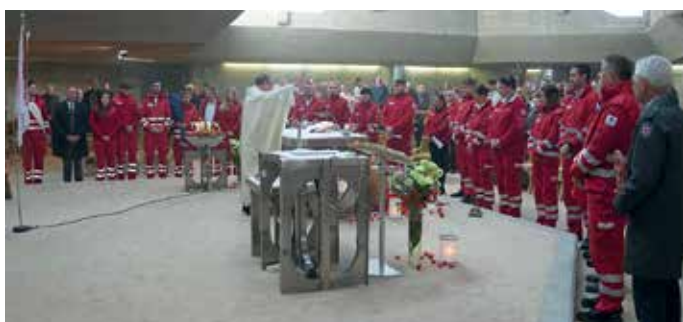
Hl. Messe mit dem Roten Kreuz