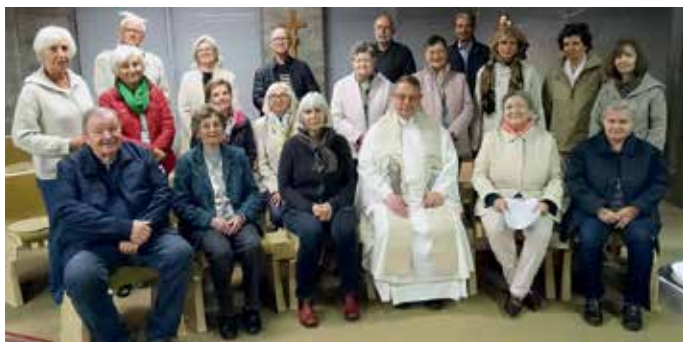
Rosenkranzgebete und Abendmesse mit dem Chor