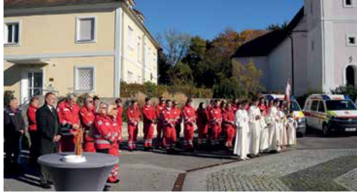
Ökumenische Segnung von Fahrzeugen des Roten Kreuzes