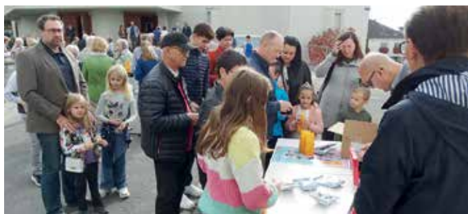
Osterkirche-Weihefest und Weltmissionssonntag