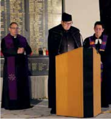
Ökumenische Friedensfeier im Stadtgarten