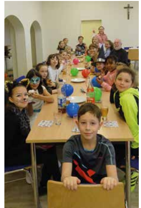
Die vielen Minis bei der Krapfenjause und einer lustigen Witze-Erzählrunde